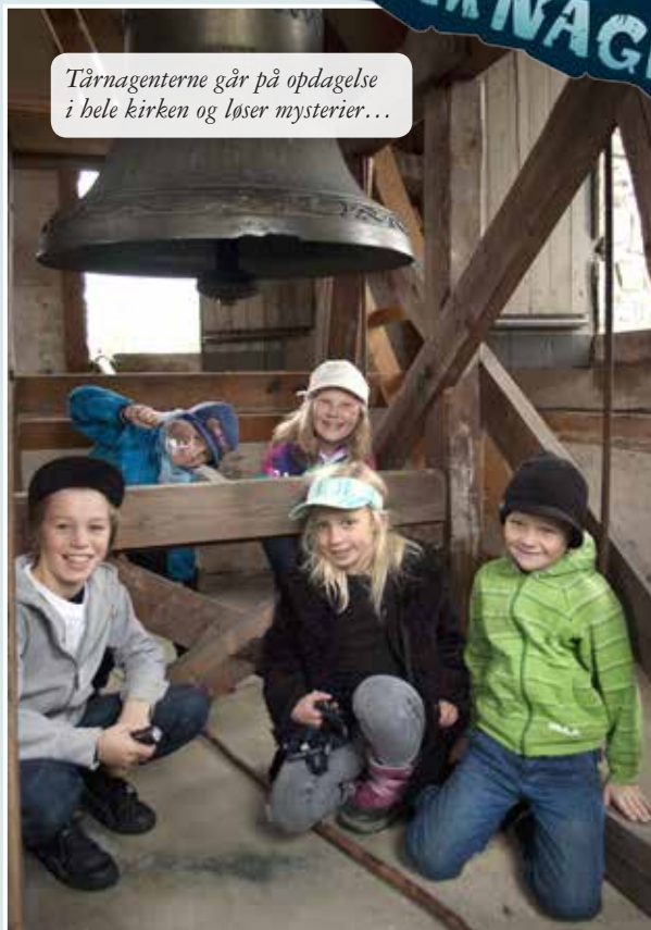
Tårnagenterne går på opdagelse i hele kirken og løser mysterier...